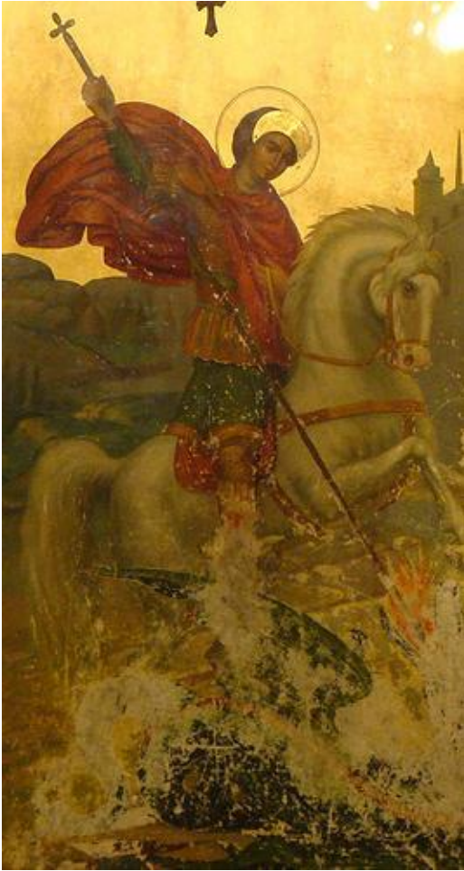
Abb. 6: Georgsikone aus dem Kloster Der Mar Djirjis, Meschtaje (Syrien).

Textnachweis: Thomas Staubli 1. Version: Schweizerische Kirchenzeitung 12 (1999), 179. 2. Version: Weisheit wurzelt im Volk. Begleiter zu den Sonntagslesungen aus dem Ersten Testament: Lesejahr A (Kirche-Bibel-Welt Bd. II), Luzern: Edition Exodus 2001, 84-87. Letzte Version: 30.10.2025.