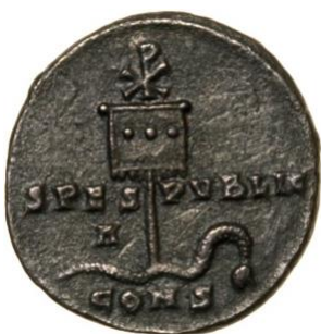
Abb. 5: Die erste in Konstantinopel von Konstantin geprägte Münze zeigt ein Feldzeichen mit den Insignien Chi-Rho über einer Schlange.