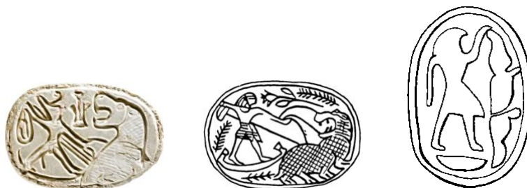
Abb. 2a-b: Siegelamulette aus Palästina/Israel mit der Darstellung einer (rituellen) Nilpferdjagd.