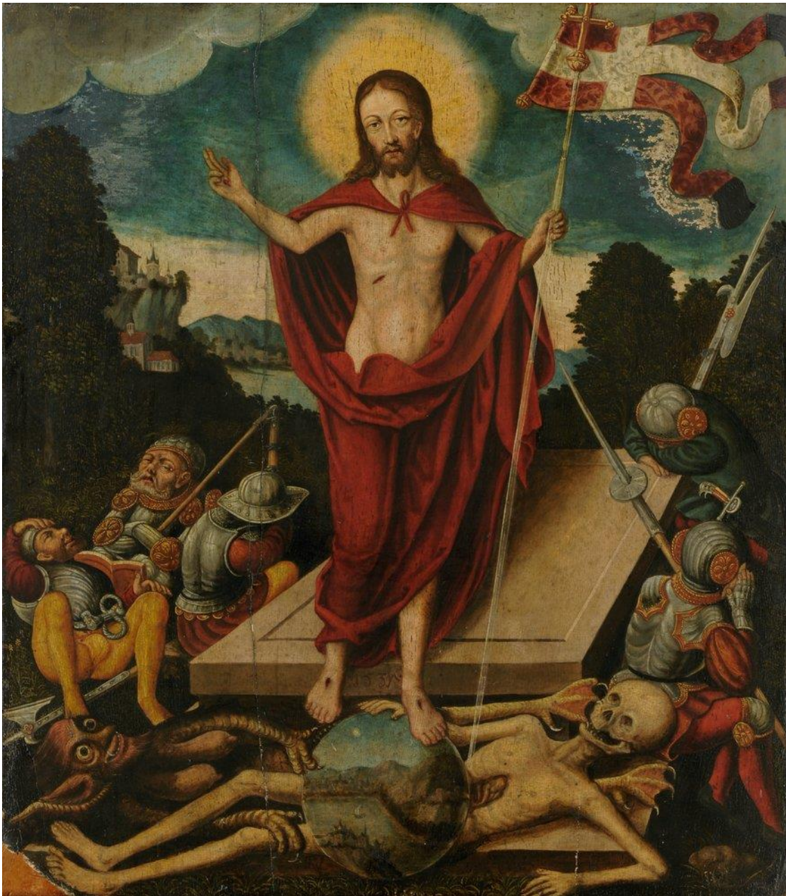
Abb. 4: Auferstehung. Christus siegt über Tod und Teufel. Öl auf Leinwand, 1537, aus der Schule von Lucas Cranach.