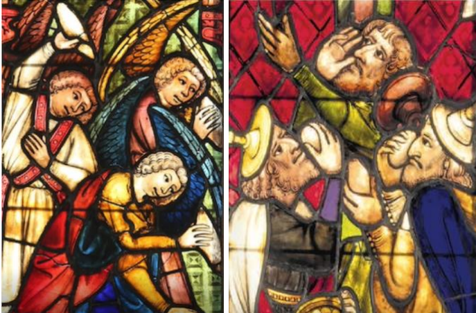
Abb. 3a-b: Mannaregen in einem Kirchenfenster aus St. Jakob in Rothenburg ob der Tauber.