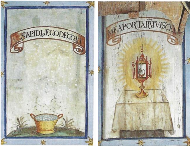
Abb. 4-5: Christus als Manna, neun Monate lang gebacken im Ofen des Leibes seiner Mutter, am Bilderhimmel von Hergiswald ob Kriens mit seinen 324 Marienemblemen. Der Spruch über dem Mannakorb lautet: «Ich habe schmackhafter gebacken.» Jener über der Monstranz: «Mein Schoß hat ihn getragen.»

Textnachweis: Thomas Staubli 1. Version: Schweizerische Kirchenzeitung 20-21 (1999), 304. 2. Version: Weisheit wurzelt im Volk. Begleiter zu den Sonntagslesungen aus dem Ersten Testament: Lesejahr A (Kirche-Bibel-Welt Bd. II), Luzern: Edition Exodus 2001, 116-118. Letzte Version: 10.4.2026.